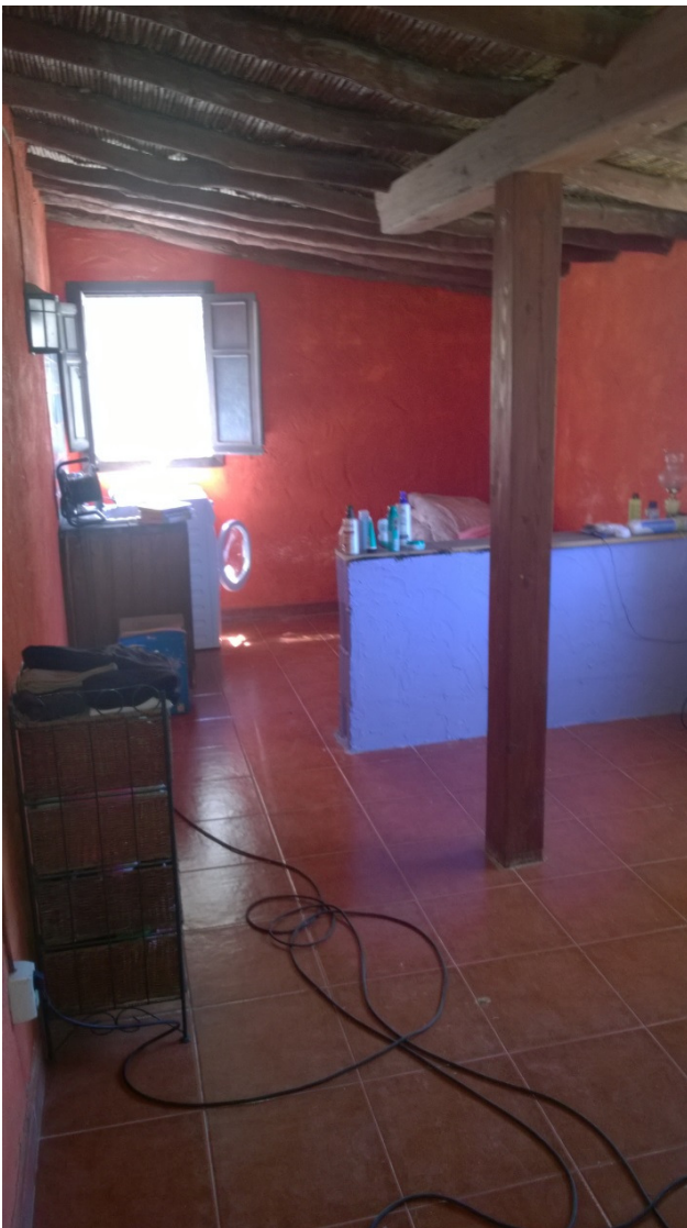
kuva opiskelijan huoneesta